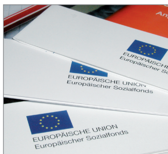
▲ Abbildung: EU-Emblem mit ESF-Kennung auf Flyern