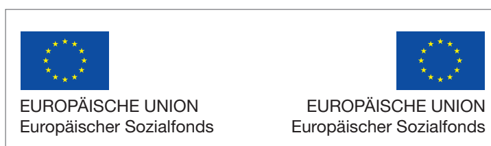
▲ Abbildung: EU-Emblem mit Fondszusatz mehrfarbig für weißen Hintergrund, Schrift linksbündig oder rechtsbündig

fonds“) hinzu. Der Name des Fonds ist unbedingt auszu-schreiben, weil nicht davon ausgegangen werden kann, dass die breite Öffentlichkeit die Abkürzung kennt.